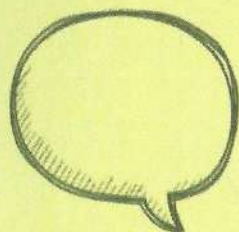
Conversar com amigos