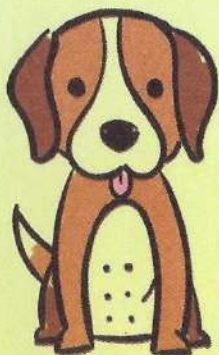
Passear com o cachorro